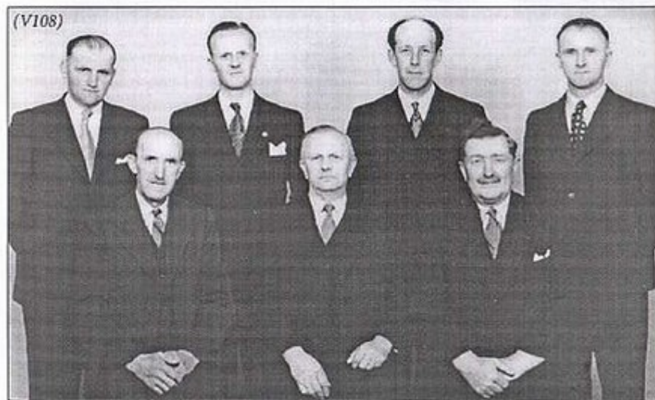
Billede af Adslev-Mesing sogneråd 1950-1954. Egnarkivet efterlyser billeder fra 1954-1962. Findes der billeder så kontakt arkivet.

Der har naturligvis været ansat lærere ved Hørning skole og ved skolerne i Adslev, Jeksen og Mjesing, men dette fremgår ikke af sammenlægningsvilkårene. Det kan ses, at der har været et