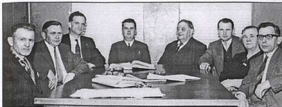
Billede af Hørning byråd 1962.

Dette var sådan spredte træk fra den første kommunesammenlægning i nuværende Hørning kommune. Materialet er dels fundet i Egnarkivet i Hørning, dels husker jeg selv lidt. Desværre lever ingen af de sognerådsmedlemmer, der besluttede sammenlægningen i 1962.