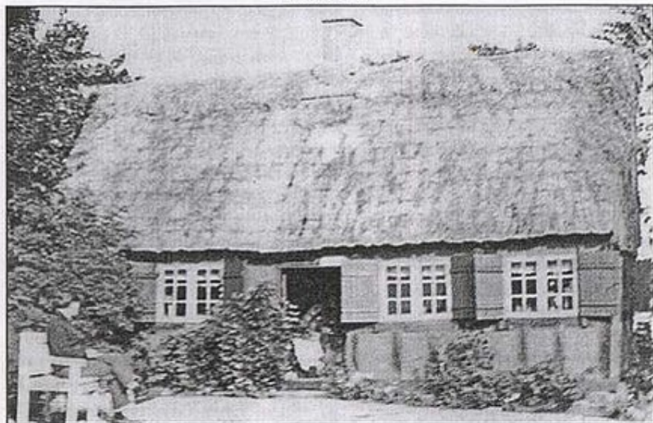
»Mjesinghuset i Ansgar Andersens have, da huset fungerede som museum.»

finder i lands- og lokalarkiver, kan man skrive et hus' historie på trods af, at meget er gået tabt for eftertiden.