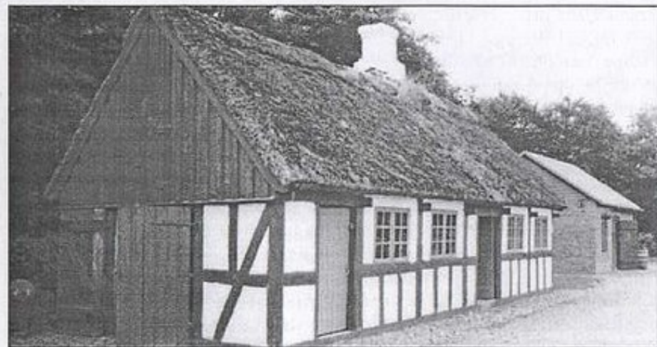
»Mjesinghuset i Ansgar Andersens have, da huset fungerede som museum.»

Mjesinghusets ændrede status gjorde, at huset og dets beboere blev en del af