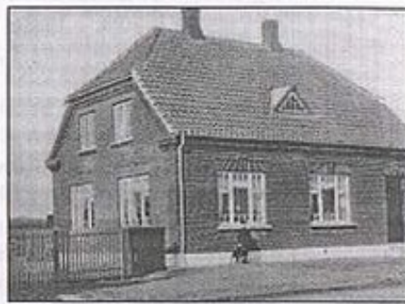
Jordemoderhuset i Hårby, postkort

Hårbyvej 45 blev bygget. I 1964 blev jordemoderhuset revet ned for at give bedre oversigt i vejkrydset.