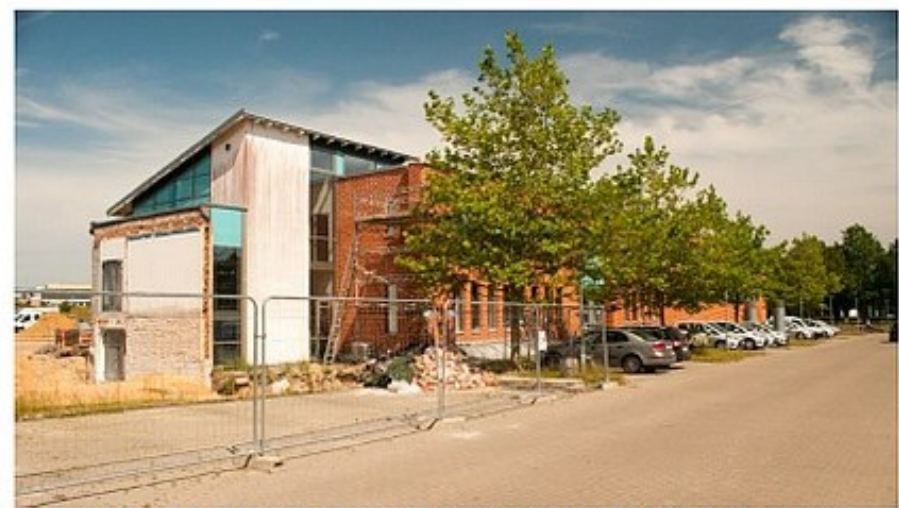
Juni 2019. Det gamle rådhus nedrevet for at give plads til etageboliger mm.