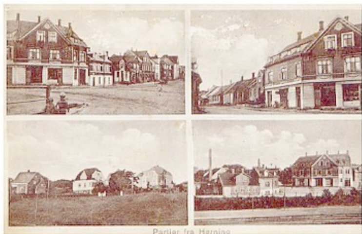
Partier fra Herning