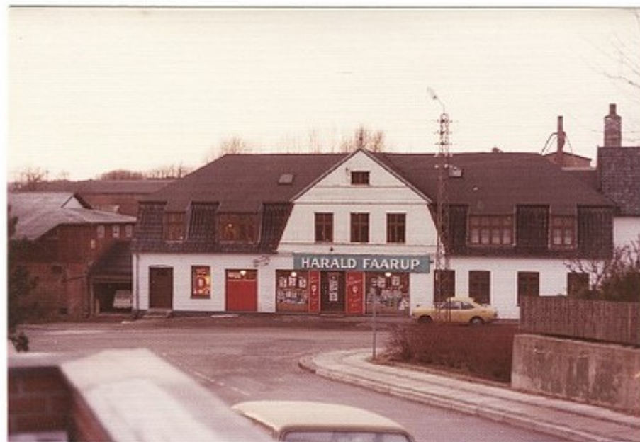
Fregrerslevvej 2, ca 1979. I 1983 blev bygningen ombygget til ejerlejligheder (B189).