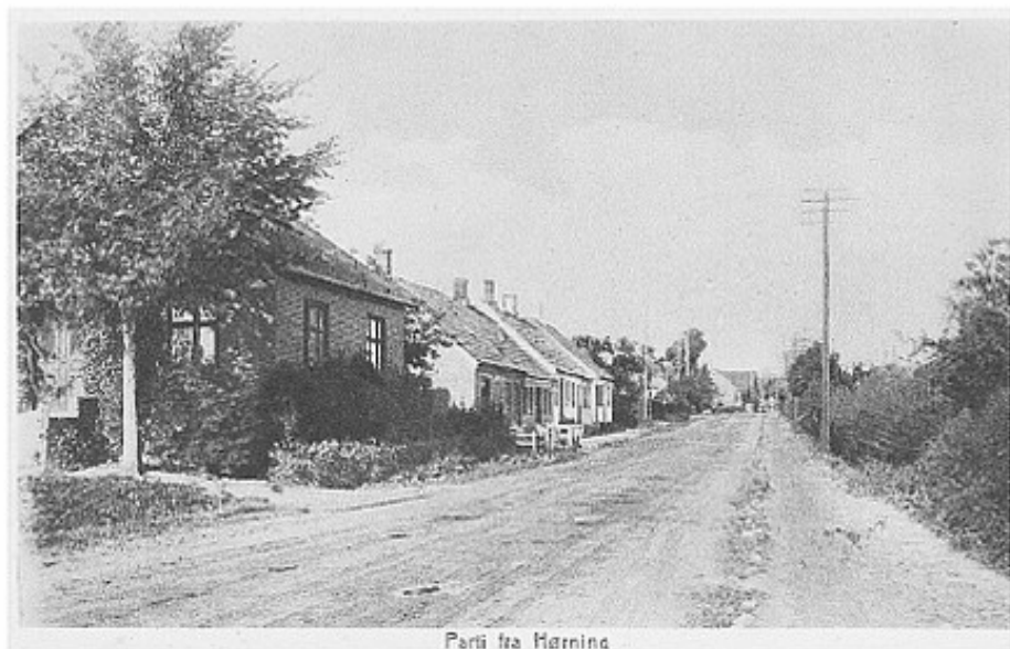
Parti fra Hørning