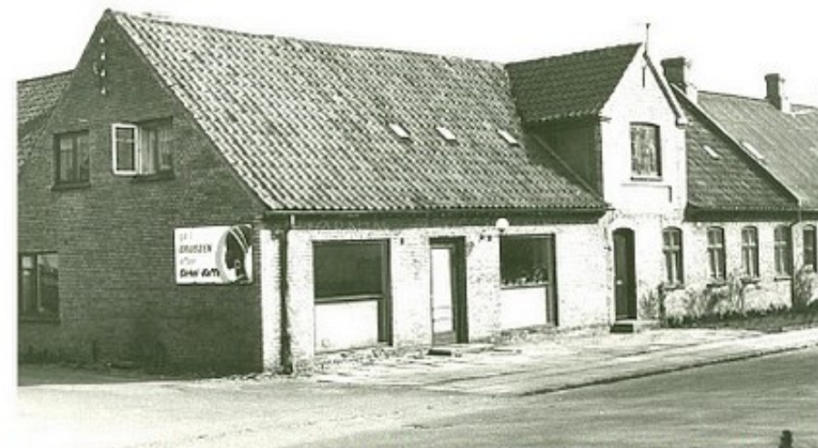
Vestervej 12, Horning. Fra 1860-1916 Skole, fra 1916-1966 Horning Brugsforening, derefter nedrevet for at give plads til nyt rådhus og bibliotek. (B426)