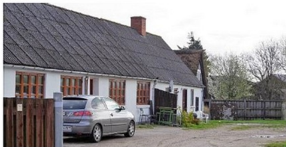
Stjørvej 21, 2017.

"Så længe a ka stå op, kører saven, for hvad skal a ellers få tiden til at gå med?" som han sagde til bladets journalist i 1984. Og det gjorde den også de næste fem år, indtil han måtte give op. Han døde den 29. maj 1989, 85 år gammel.