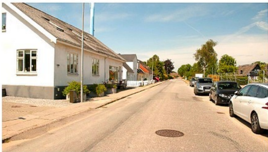
Juni 2019. Med byggeplads som genbo.