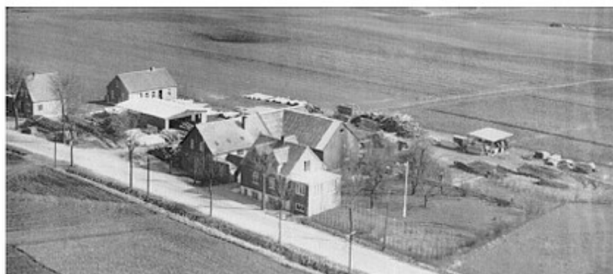
Hårby Savværk 1950

Han slutter interviewet af med; "Jeg synes, det går godt i øjeblikket, og kan jeg blot blive ved med at holde savværket i gang i den størrelse, det har nu, er jeg tilfreds. Det skal ikke arbejdes op til at være alt for stort".