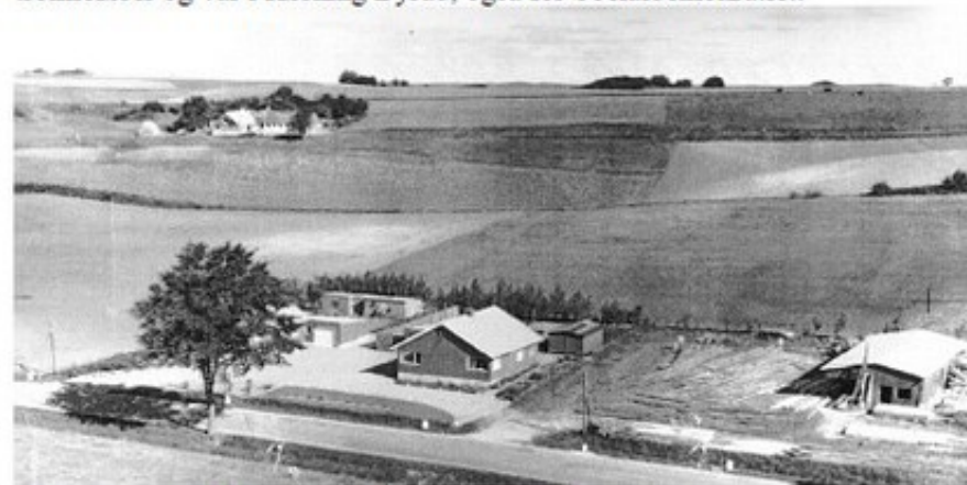
Låsbyvej 106 – 1950.