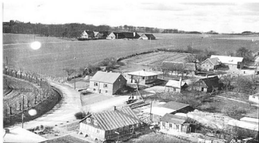
Vidkærvej 20 – 1950.