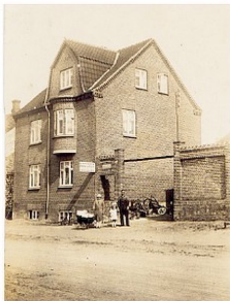
Smedeværksted Fregerslevvej 13, Høring. 1928 (B309).