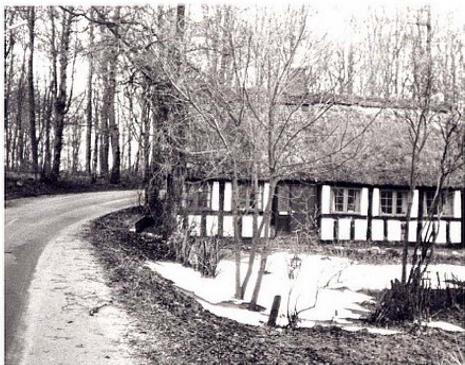
Skovhuset, Fregerslevvej 35. (B147)