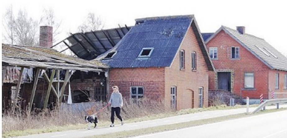
En del af resterne af "savværksbyen" ved Låsbyvej 60, fotograferet i 2017 af Erna Bachmann (F2251 og F2254)