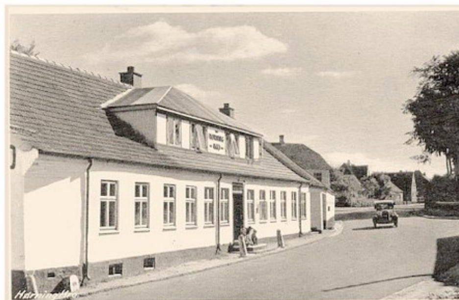
Århusvej 4, Hørning Kro mellem 1940 og 1953. I 1953 blev bygningerne revet ned for at give plads til ændret linjeføring af hovedvejen. (B101).