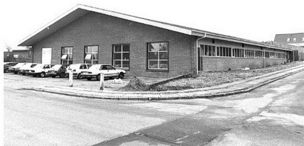
Kildevej 6, Hørning. 1989. Har huset bl.a. Squashcenter og Hummel, senere ombygget til 16 ejerlejligheder. (B1629).